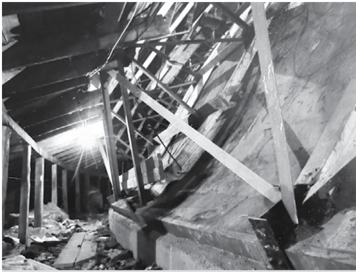
Так выглядит подкупольное пространство спустя 10 лет после «завершения» ремонтных работ на НГАТОиБ

«Строительные ведомости» уже рассказывали об этой проблеме, но мы думаем: в таком деле не грех и повториться. Тем более что сейчас, в связи с санитарно-эпидемиологическими ограничениями в проведении массовых мероприятий, Оперный